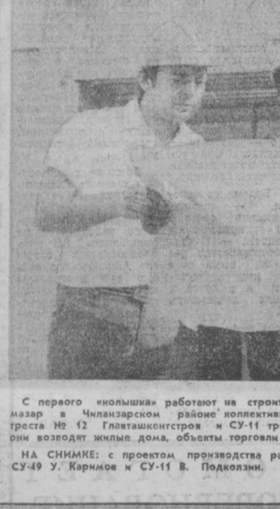
С первого «кюльша» работают на строительстве микрорайона Алазар в Чиланзарском районе коллективы генподрядного СУ-49 треста № 12 Глоушкестрой и СУ-11 треста «Отдестрой».