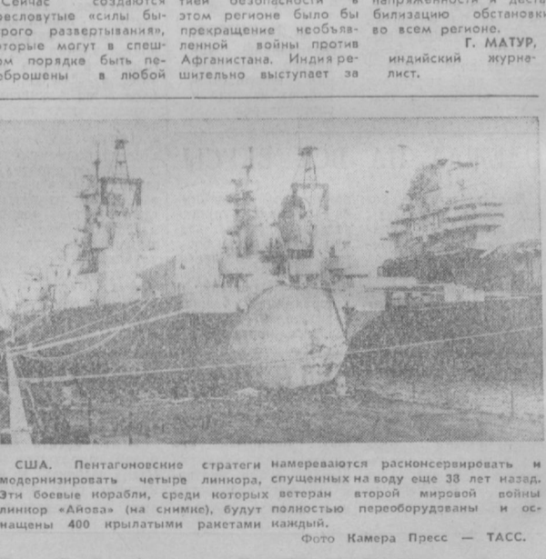
США. Пентагонские стратеги намереваются расконсервировать и модернизировать четыре линкора, служивших на вою еще 38 лет назад. Эти боевые корабли, среди которых ветоим второй мировой войны линкор «Алабама» (в центре), будут полностью переоборудованы и оснащены 400 крылатыми ракетами каждый.