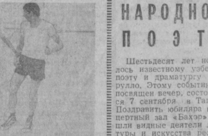
Принятое и бодрое настроение царит в этот день на стадионе «Текстильщик». Развлекать зрителей, динамики громкоговорителей разносит над стадионом судейские приказания. В настоящий спортивный праздник вылился проходивший здесь XIX спартакиада обкома профсоюза рабочих местной промышленности и коммунально-бытовых предприятий.

Финальным соревнованием спартакиады предшествовали массовые старты в коллективах физкультуры. Лучшие приняли участие в финальных стартах спартакиады. НА СНИМКЕ: парад участников спартакиады. Матч по мини-футболу.