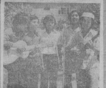
В Назарбике, пострадавшем от землетрясения, быстрыми темпами идет строительство жилья, объектов культурно-бытового назначения. Активное участие в восстановительных работах принимают студенческие строительные отряды. В их составе — люди разных национальностей.

Подведены итоги трудового семестра интернационального советско-афганского студенческого строительного отряда, принимавшего участие в возведении Анженской ГРЭС-2. В его составе было 100 человек, в том числе 50 студентов, занимающихся в Ташкентском государственном университете имени В. И. Ленина.