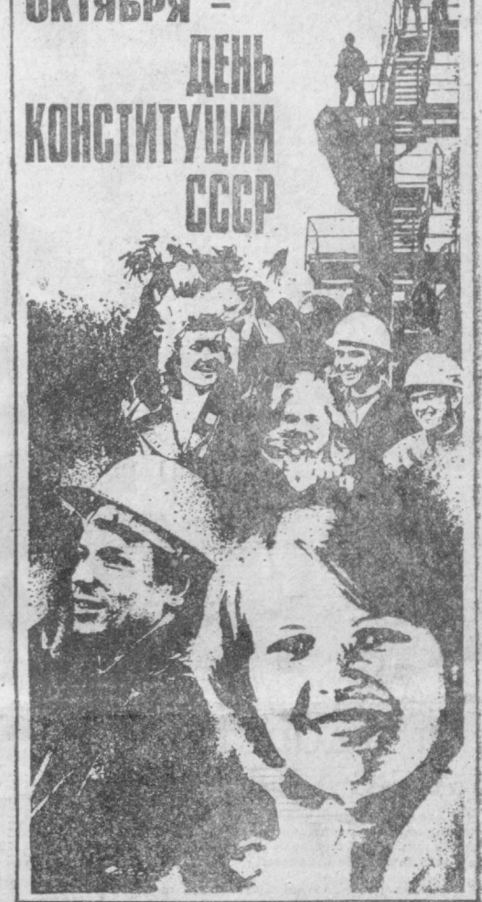
Плакат В. Дачкина.

Ученые, члены общества «Знание» выступают в эти дни на предприятиях, в учреждениях, по месту жительства с лекциями, беседами, посвященными Конституции СССР, советскому образу жизни.