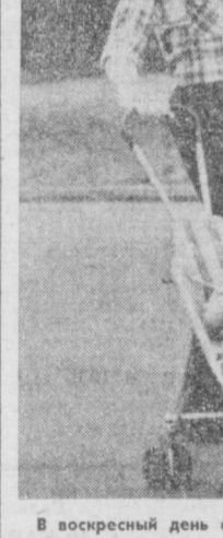
В воскресный день с папой.

Словом, каждый старался выгородить себя. Не принял мер и его друг Уезденов (он осужден на 15 лет лишения свободы). Когда выплыл все трое не выполнили своего гражданского долга. А ведь имели полную возможность без риска для себя задержать преступника.