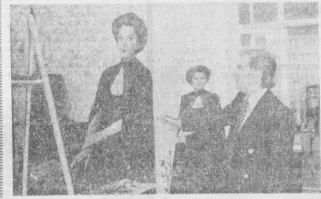
МОСКВА. Народный художник СССР Илья Глазунов заканчивает свою новую работу — портрет Народной артистки СССР, солистки Государственного академического Большого театра Союза ССР Елены Образцовой.

И все же мы вполне могли выступить лучше. В мужской сборной отличились только метатели, которые по итогам соревнований, как это было решено еще в ходе предсезонной подготовки, на протяжении последних месяцев неослабно тренировались. Так, в традиционных матчах с командами Италии, ГДР, США, Англии, а также в полуфиналах континентального Кубка мы дали возможность стартовать более чем тремстам кандидатам.