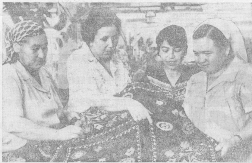
Более чем на 20 миллионов рублей выпускает ежегодно продукции коллектив Ташкентской фабрики художественных изделий. Двадцать один процент от ее общего количества маркируется Знаком качества. В этом году число изделий с почетным пятиугольником еще больше увеличилось.

Ежегодно головная и цеховые группы проводят около 50 проверок и рейсов по самым различным направлениям деятельности коллектива. После чего на заседаниях головной группы, парткома, партийных бюро, на общих собраниях обсуждаются результаты и заслушиваются отчеты виновных в недостатках. По материалам проверок издаются приказы о привлечении провинившихся к дисциплинар-