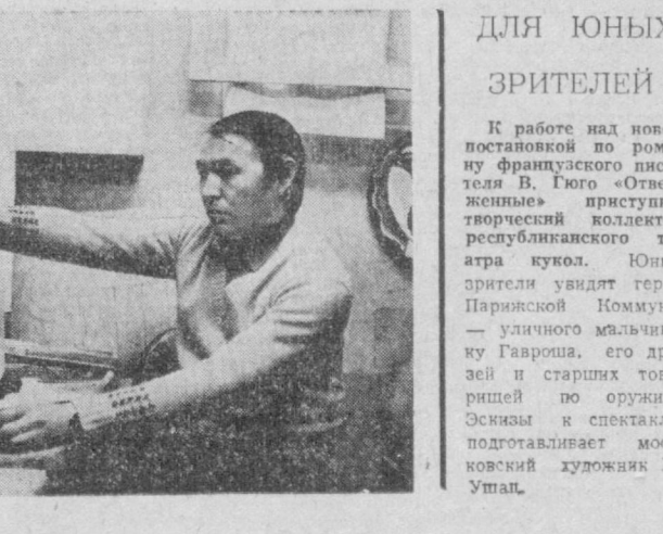
ДЛЯ ЮНЫХ ЗРИТЕЛЕЙ

Жидой массиве Юнусабад в Кировском районе уже не называют новым. Возник он десять лет назад. Однако новоселы здесь немало. Совсем недавно справились их в благоустроенных квартирах сотни семей кировчан на улице А. Даниша, малыши четырех летних садов на 960 мест, работники табачной фабрики в еще одной производственном корпусе, продавцы открывшихся двух продовольственных магазинов. Благоустроенным выглядят многие улицы, дороги и тротуары. Все эти объекты возведены по наказам избирателей. Ташкентского домостроительного комбината № 1 Главташкентстроя сдала в эксплуатацию шестизвездочный 45-квартирный дом. Монтаж конструкций вел бригады второго, а отделку — первого управлений этого комбината. Сейчас здесь готовится к вводу еще один дом на 60 квартир.