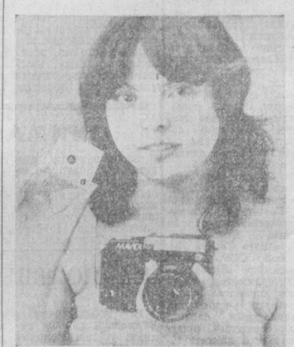
Япония. Новое устройство, совмещающее в себе признаки фотокамеры и видеоминифона, создали специалисты фирмы «Сони». Аппарат, получивший название «Мавина» (на снимке) зарисовывается на фотопленку, а миниатюрный магнитный диск. На одном диске записывается 50 цветных кадров, которые затем через приставку можно воспроизвести в обычном домашнем телевизоре.

В американском штате Колорадо, зарегистрирован бурный всплеск местного патриотизма. Общественные объединения и инициативные группы жителей штата, предложили своим членам украсить бамперы автомашин наклейками с надписью «местный». Этот шаг был воспринят как вызов тем, кто не может претендовать на участие в этом обществе. В ответ появились бамперные наклейки «иностранец», «переселенец», «чужак». Некоторые, правда, предпочли остаться в стороне от «пора, изображая на своих машинах вопрос «А кто, все ли равно?», на что последовал незамедлительный ответ значимой раздора — «Мне тем же все равно». Косоплана Нессе На севере Индия, на границе с Китаем, находится гора Пантусан — одна из красивейших