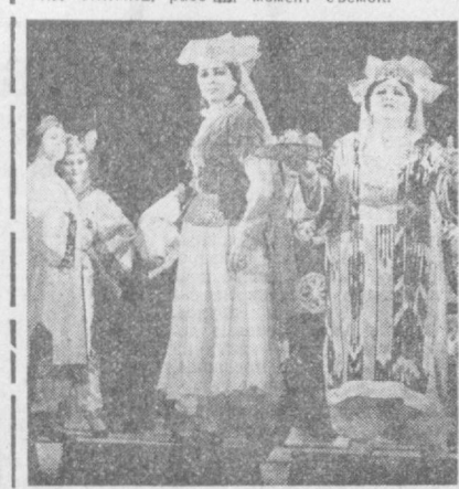
С большим успехом прошла в Ташкентском Государственном театре музыкальной комедии премьера оперетты Э. Салихова «Ходжа Насреддин». Спектакль посвящен приближающемуся 2000-летию Ташкента.