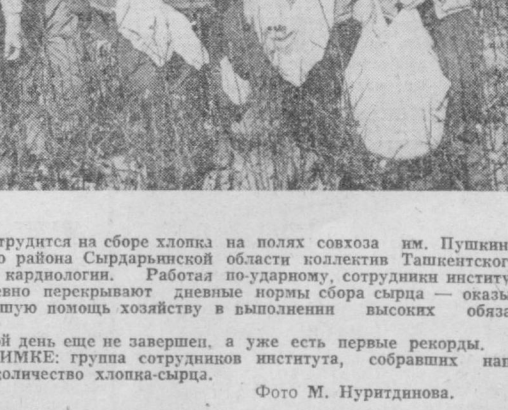
Хорошо трудятся на сборе хлопка на полях совхоза им. Пушкина Балутского района Сырдарьинской области коллектив Ташкентского института кардиологии. Работая по ударному, сотрудники института ежедневно перекрывают дневные нормы сбора сырья — оказывают большую помощь хозяйству в выполнении высоких обязательств. Трудовой день еще не завершён, а уже есть первые рекорды. НА СНИМКЕ: группа сотрудников института, собравших наибольшее количество хлопка-сырца.

У студентов республиканского педагогического института русский язык и литература в этот вечер был настоящим праздником — местный вокально-инструментальный ансамбль дал для сбора хлопка концерт. Звучали русские, узбекские песни, а потом были танцы.