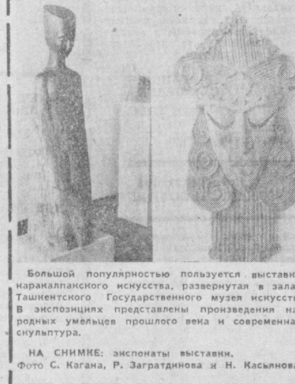
Большой популярностью пользуется выставка каракалпакского искусства, развернутая в залах Ташкентского Государственного музея искусства. В экспозициях представлены произведения народных умельцев прошлого века и современной скульптуры.

НА СНИМКЕ: экспонаты выставки.