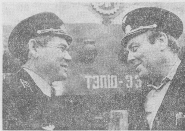
Ударным трудом знаменуют коммунистический субботник трудящиеся столицы Узбекистана.