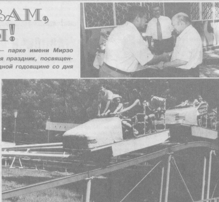
Соб. инф. НА СНИМКАХ: праздник в парке.