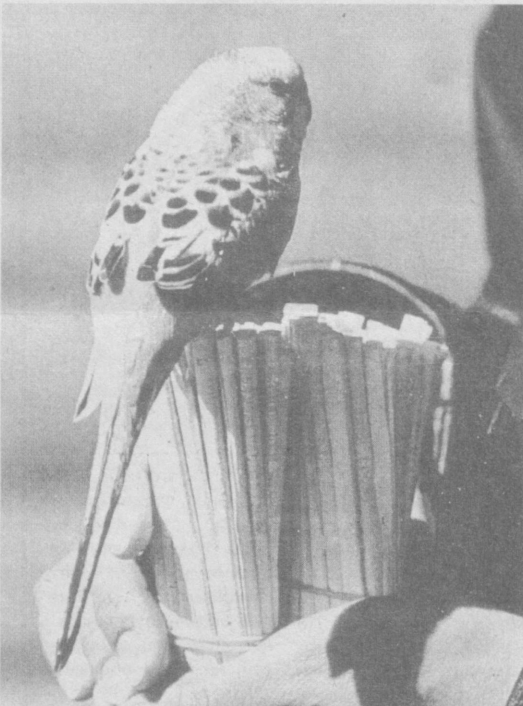
Испытайте судьбу!..