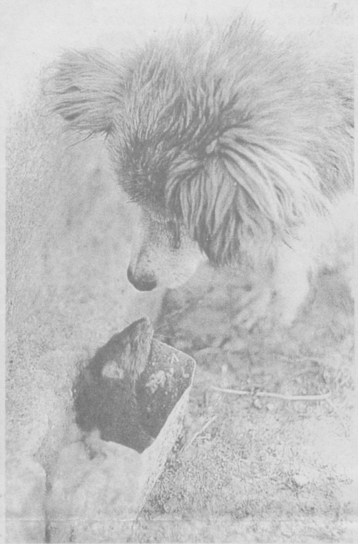
Давай познакомимся!