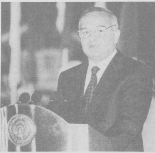
общечеловеческие ценности, способны достичь заветных рубежей.

И поэтому с уверенностью можно сказать: мы — народ Узбекистана, наследники великих предков, хозяйева богатейшего потенциала — можем ставить перед собой высокие цели и, опираясь на бессмертное наследие,