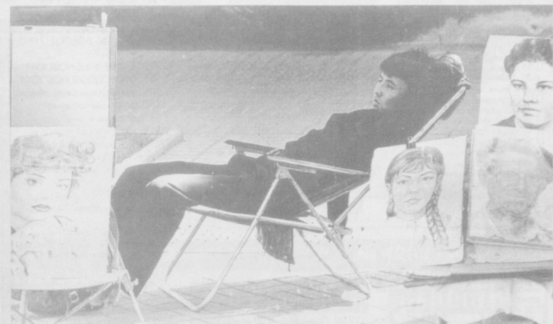
Из жизни Сайилгоха.