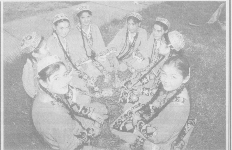
Словно весенний сад...

— Поздно, Фара, уже поздно... — по барабанному перепонкам застучали короткие гудки.