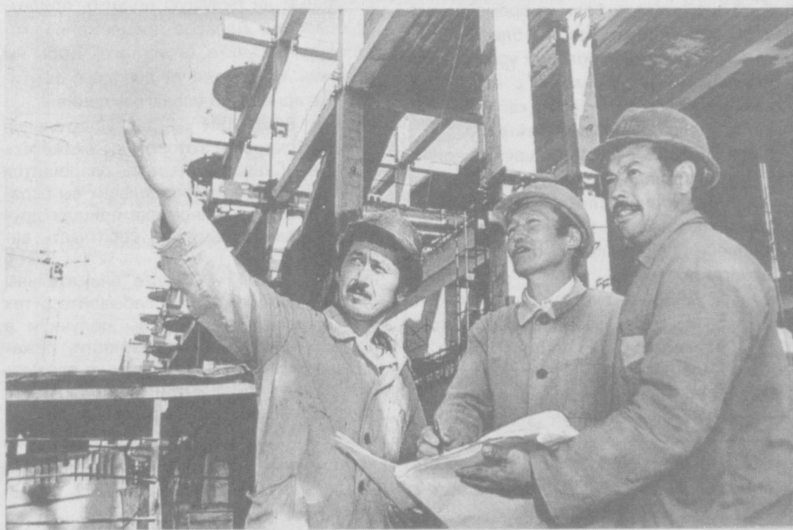
На строительных площадках

Каждый проезжающий или проходящий мимо этой огромной стройплощадки уже может увидеть конкретные очертания корпусов новой консерватории — административного и трех учебных. В них расположатся лекционные аудитории для двадцати двух факультетов и кафедр, библиотек и в том числе и нотная, а также фонотеки и кабинеты для