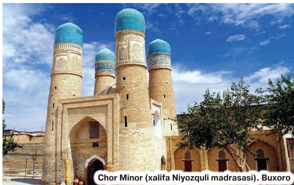
Chor Minor (xalifa Niyozquli madrasasi). Buxoro

Maqolani qoraqalpoq tilida o'qish uchun QR-kodni skaner qiling.