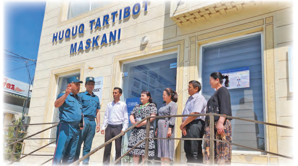
Mayor Aminjon Avezov mahalla faollari bilan birga navbatdagi ishni rejalashtirmoqda.

qo'rganlar va ishsizlar tomonidan jinoyatlar umuman sodir etilmadi.