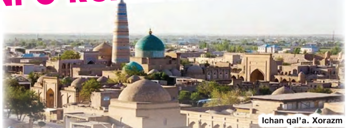
Ichan qal'a. Xorazm

Nafaqat Samarqandning, balki butun O'zbekistonning ramzi bo'lgan Registon maydoni shaharning tashrif qog'ozi hisoblanadi. Samarqandga borgan kishi borki, Registon ansamblini ko'rmasdan qaytmaydi. Registon maydoni Samarqandning markazi hisoblangan. U yerda bozor mavjud bo'lgan. XV asrda Mirzo Ulug'bek bu yerda madrasa, xonaqoh, karvonsaroy qurdirgan. XVII asrga kelib Samarqand hokimi Yalangto'sh Bahodir Ulug'bek madrasasi ro'parasida, xonaqoh o'rnida katta madrasa qurdirgan. Peshtoqidagi sher tasviri tushirilgan bezaklari uchun xalq orasida Sherdor nomi bilan mashhur. Maydonning g'arbiy qismida