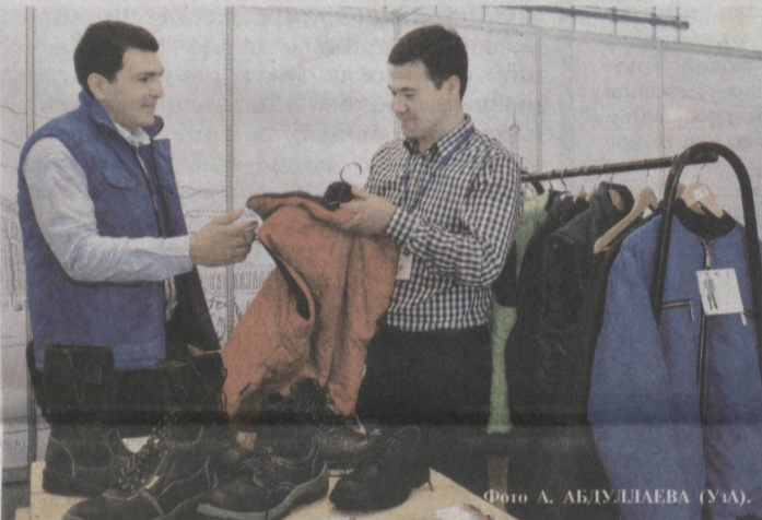
Продукция отечественных предприятий пользуется большим спросом.