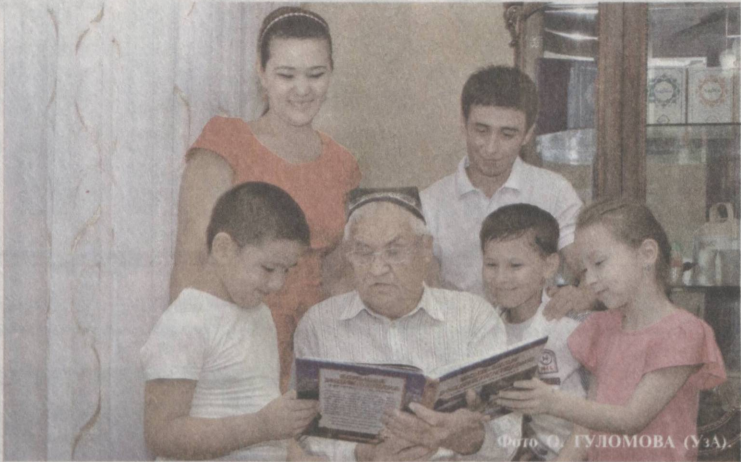
Советы и наставления старших играют большую роль в воспитании подрастающего поколения.