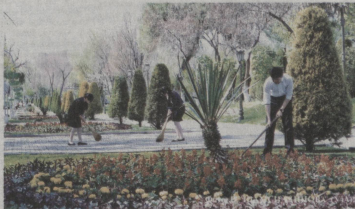
С заботой об экологии родного города.