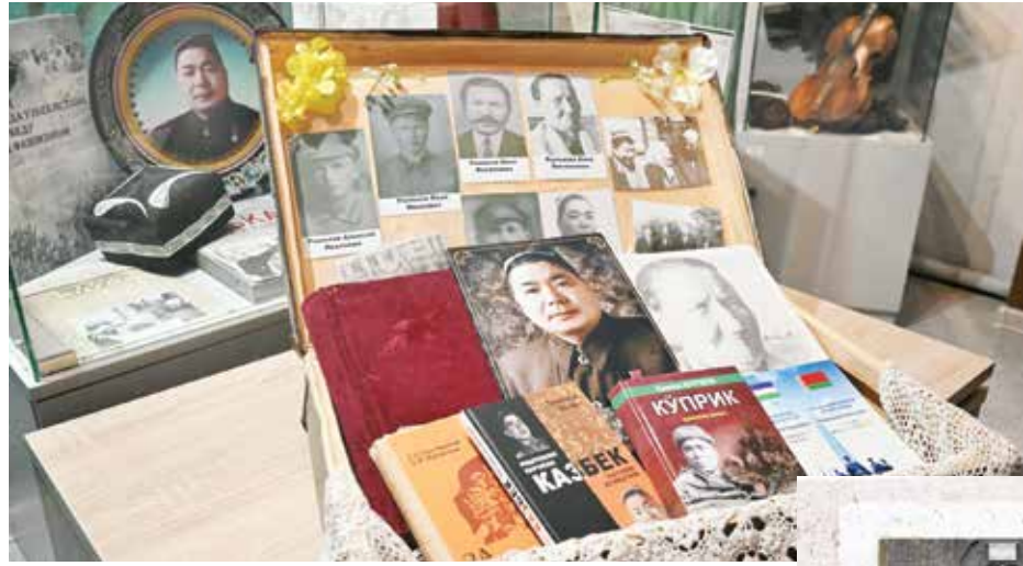
xizmatlari uchun qahramonlik unvoni beriladi.

Urushdan keyingi yillarda Topvoldiyev bir necha bor Belarusga kelib, jangda birga qatnashgan partizan do'stlari bilan uchrashgan. "Men ular bilan o'rmon