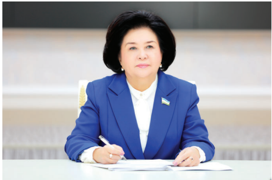
Робахон МАХМУДОВА, Ўзбекистон “Адолат” СДП Сиёсий Кенгаши раиси, Олий Мажлис Қонунчилик палатасидаги партия фракцияси раҳбари

Давлатимиз раҳбари раислигида ўтказилган бирламчи бўғин ва ихтисослашган муассасаларда хизматлар сифатини ошириш, дори воситалари истеъмолини тартибга солиш ҳамда тиббий таълимни замон талабларига мос равишда ислоҳ қилишга қаратилган видеоселектор йиғилиши миллий соғлиқни сақлаш соҳасидаги долзарб муаммоларни ҳал этишда янги ёндашувларни қамраб олгани билан аҳамиятли бўлди.