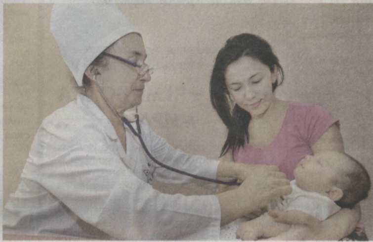
Повышается уровень медицинского обслуживания.