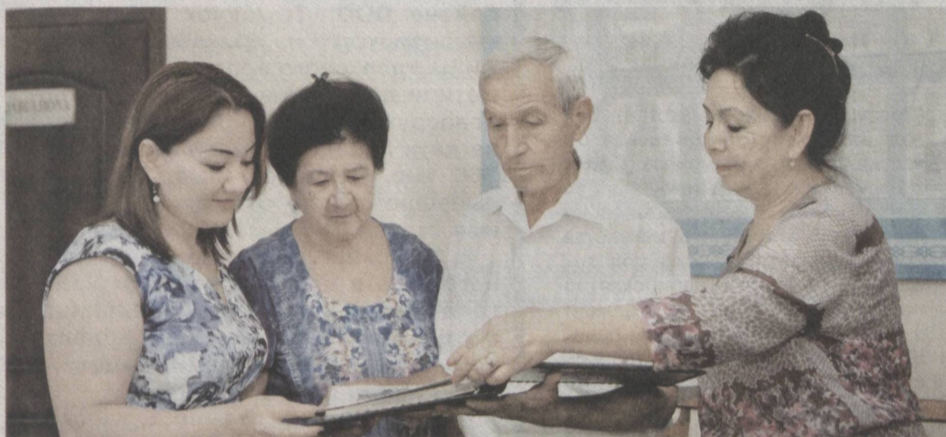
За годы независимости значительно повысился статус махалли.

В годы независимости особое внимание уделяется повышению статуса махаллей, расширению их возможностей и полномочий, укреплению материально-технической базы.