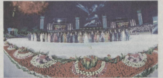
В НАЦИОНАЛЬНОМ ПАРКЕ УЗБЕКИСТАНА ИМЕНИ АЛИШЕРА НАВОИ СОСТОЯЛИСЬ ПРАЗДНИЧНЫЕ ТОРЖЕСТВА, ПОСВЯЩЕННЫЕ ДВАДЦАТИЧЕТЫРЕХЛЕТИЮ ГОСУДАРСТВЕННОЙ НЕЗАВИСИМОСТИ РЕСПУБЛИКИ УЗБЕКИСТАН