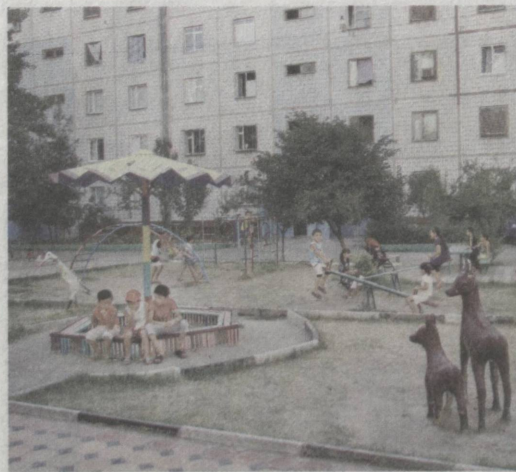
Все условия для счастливого детства.