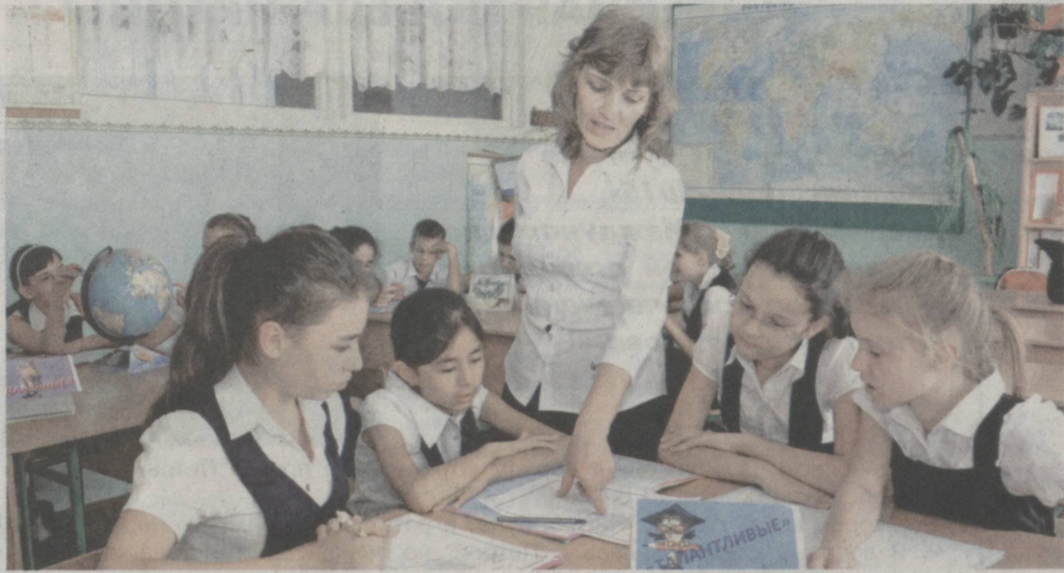
По дорогам знаний.