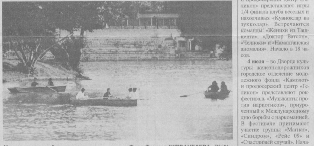
На воде в жаркий полдень.