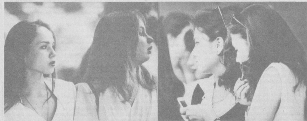
Лето. Кровь играет. Хорошенькие девушки мечтают... о поступлении в институт.