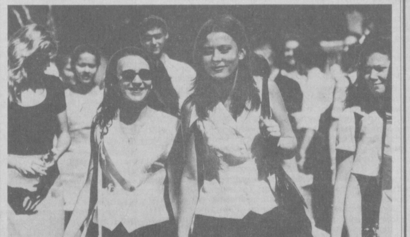
Читатели заметили, что «Пресс-Витраж» любит «холодные» снимки (это там, где запечатлен грядущий народ). Ну нравится нашей молодежи фланировать по улицам. Что мы можем поделать? Только и остается шелкать фотоаппаратом.