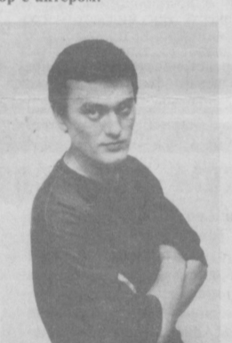
ные и драматические роли. Осуществить свою мечту смог в 1988 году.