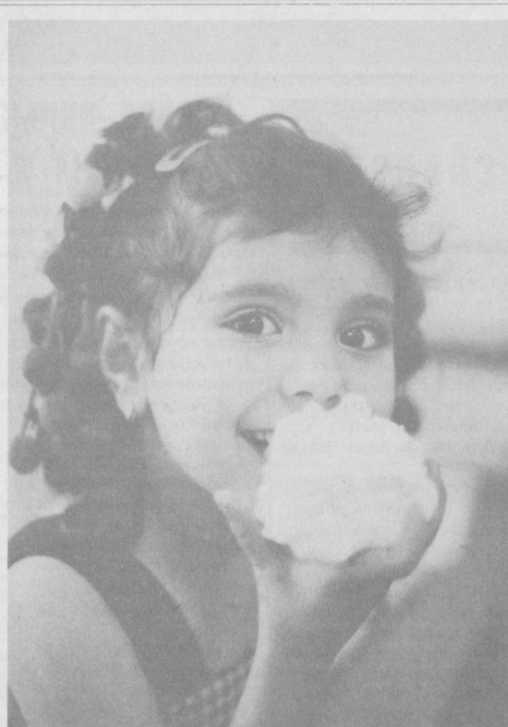
Какие же они сладкие — наши дети!