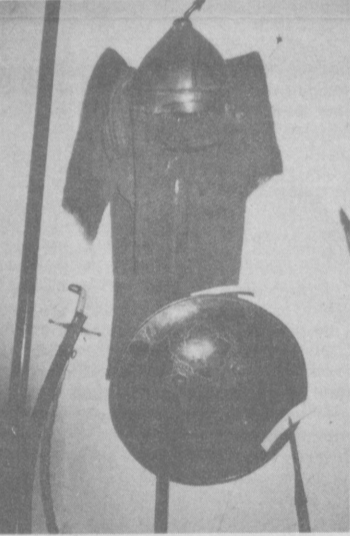
и комплекты военной одежды, кольчуги, латы, сделанные мастерами Самарканда, Бухары и Таш-

Экспонаты, представленные в экспозиции, достаточно полно и интересно знакомят посетителя с историей оружия Узбекистана. Здесь можно увидеть всевозможное военное снаряжение, начиная от различных топорилов, боевых луков, стрел, клевых, секир, мечей и заканчивая шомпольными ружьями и кремневыми пистолетами. Большой интерес вызывают