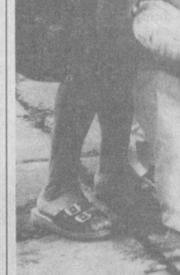
Первая встреча с искусством.