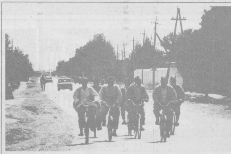
И пешком — хорошо, на машине — хорошо, а на велосипеде — лучше...