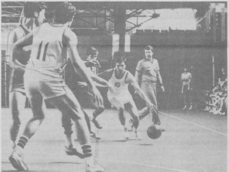
Опасный момент.

«Вечерке Ташкенту» — приходите к нам на вечеринку «Стрелки» Беседовал Ораз АБДУРАЗАКОВ.