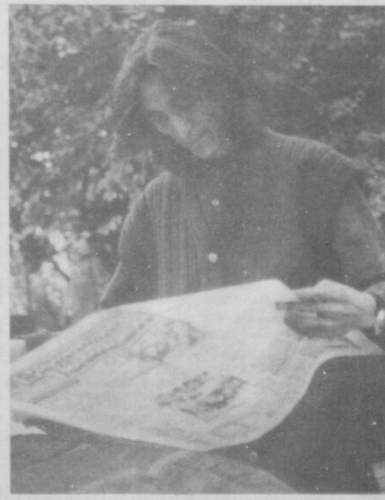
Соб. инф.

● Неожиданного успеха на промежуточных выборах в Конгресс США добилась демократия. Они отвоинили еще пять мест в парламенте, и хотя республиканцы продолжают удерживать большинство, результаты выборов — серьезная поддержка президенту Б. Клинтону и удар по намерениям республиканцев начать процедуру его импичмента в связи со скандалом с М. Левински.