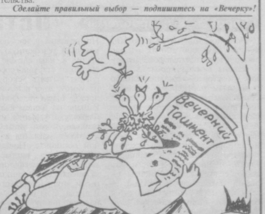
Рис. В. КОЛЕСНИКОВОЙ.

• В Латвии начали действовать поправки к закону о гражданстве. Теперь принять гражданство могут все неграждане независимо от возраста.