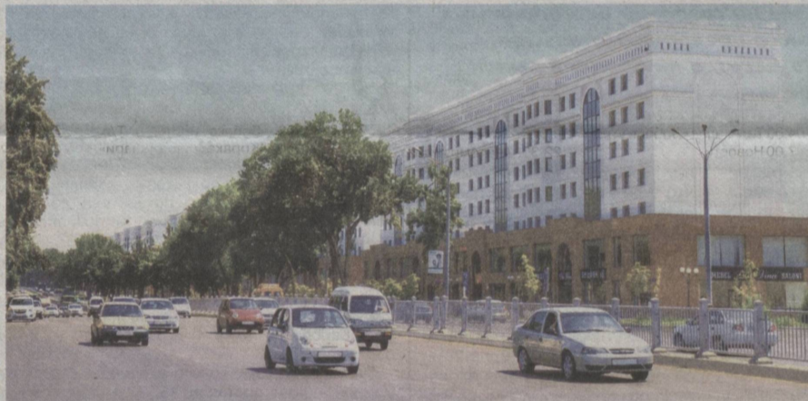
Новый жилой комплекс.