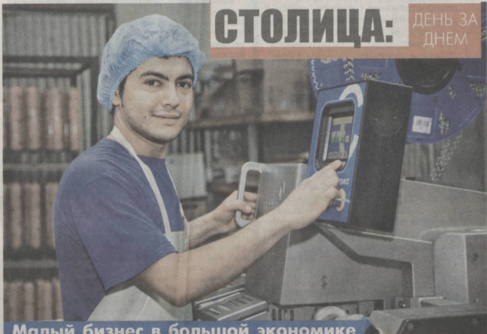
Малый бизнес в большой экономике