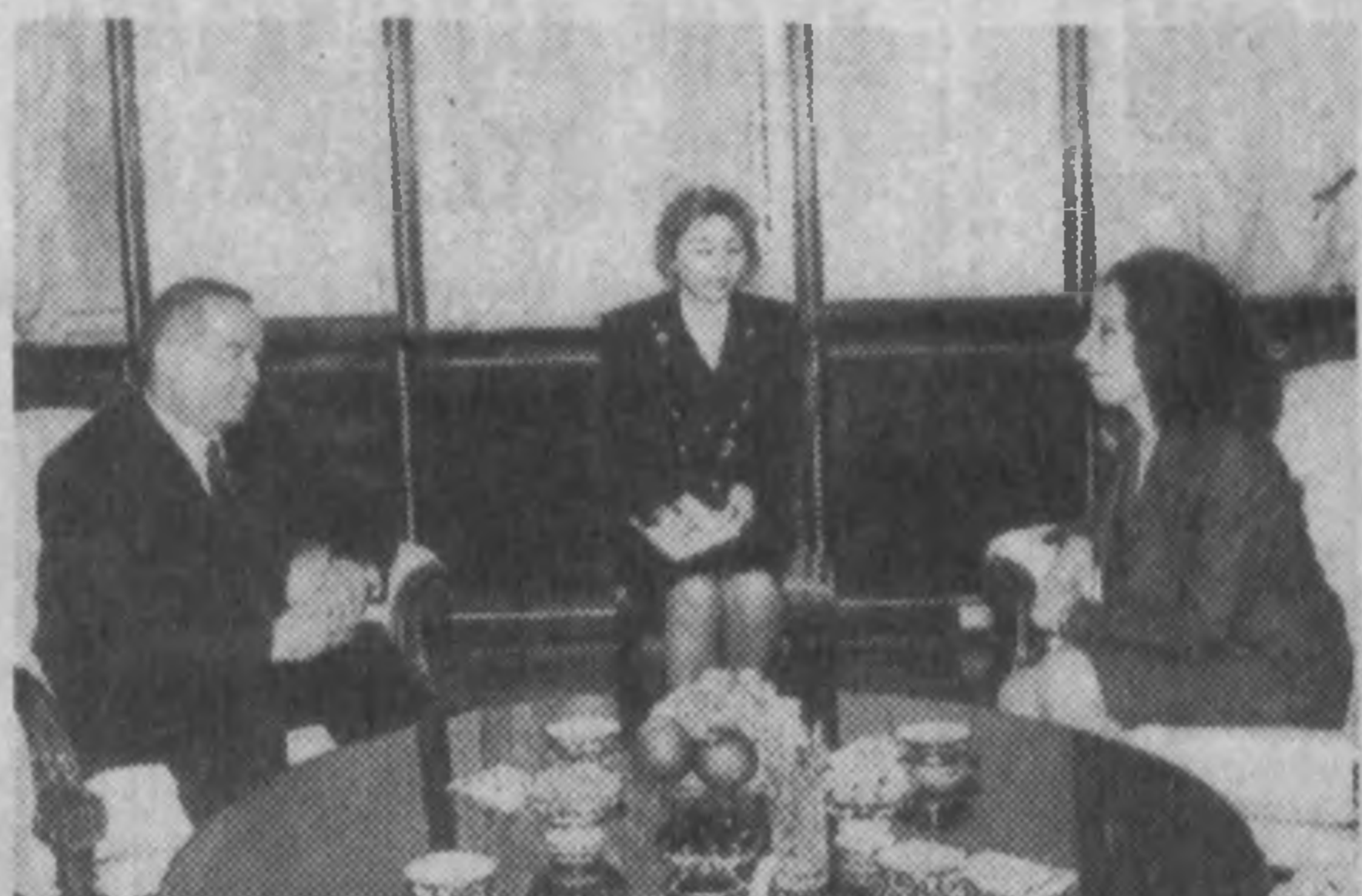
СУРАТЛАРДА: ишонч ёрлиқларини топшириш пайти.

— Ўзбекистон халқи мамлакат иқтисодиётини юксаттириш йўлида самарали меҳнат қилмоқда, — де-