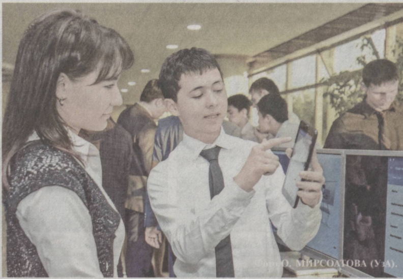
Мирзо-Улугбекский район, Мирсоатова (Уз.)

Всего в течение 2013–2015 годов участие в конкурсе приняли более 2800 юношей и девушек. Ими было представлено более 1300 веб-сайтов и около 1500 фотографий, видеороликов и фотоколлекций. Примечательно, что