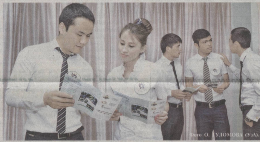
Наша молодежь эффективно использует созданные для нее возможности в образовании, науке и других сферах.