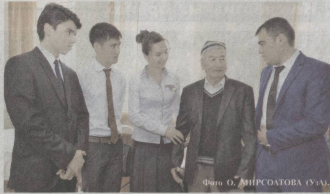
Неразрывная связь поколений.

2015 год – Год внимания и заботы о старшем поколении