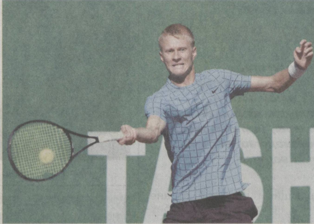
В стремлении к высоким результатам в спорте.