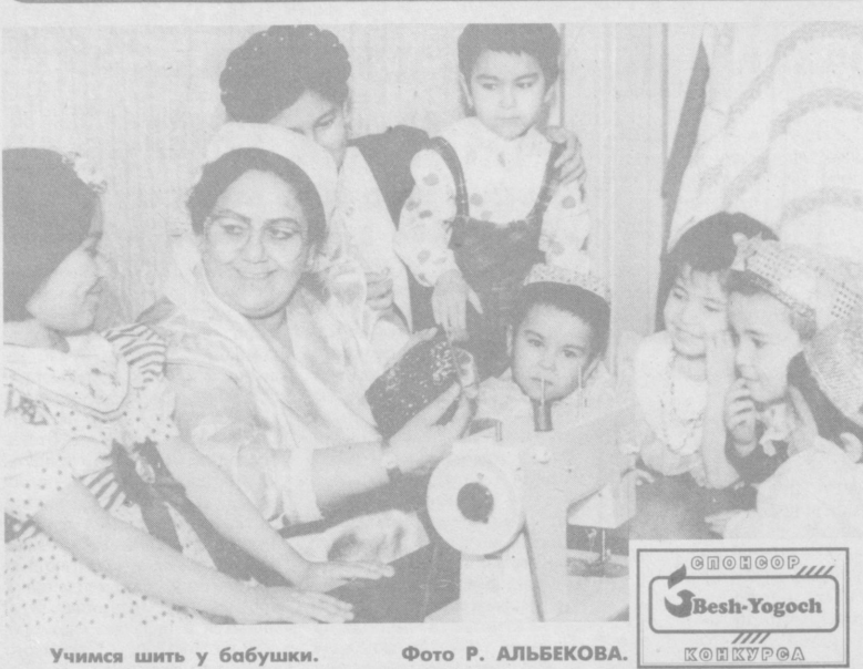
Учимся шить у бабушки.