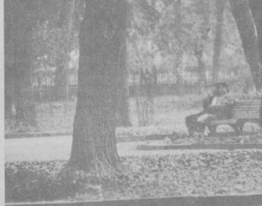
В старом парке.

Как известно, вопрос о размещении и строительстве того или иного объекта начинается с составления проекта сметной документации. Именно на этой стадии проектировщики должны внимательно изучить полный комплекс технологических, геологических, социально-экономических и экологических факторов воздействия проектируемого объекта. Это касается не только объектов чисто производственного назначения, но и жилищно-гражданского строительства, спорткомплексов и т.п., которые также могут стать потенциальными загрязнителями окружающей среды.