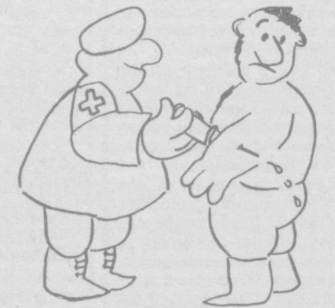
Рис. В. КОЛЕСНИКОВОЙ.

Юноша решил похитить свою возлюбленную. В полночь он ушел ее через окно и на такси поехал на вокзал. Приехав на место, он спрашивает у водителя: — Сколько я вам должен? — Ничего, отец новости уже расчитался.