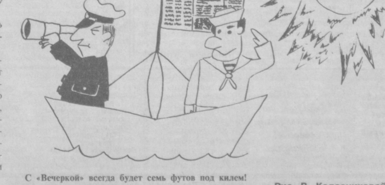
С «Вечеркой» всегда будет семь футов под килем!