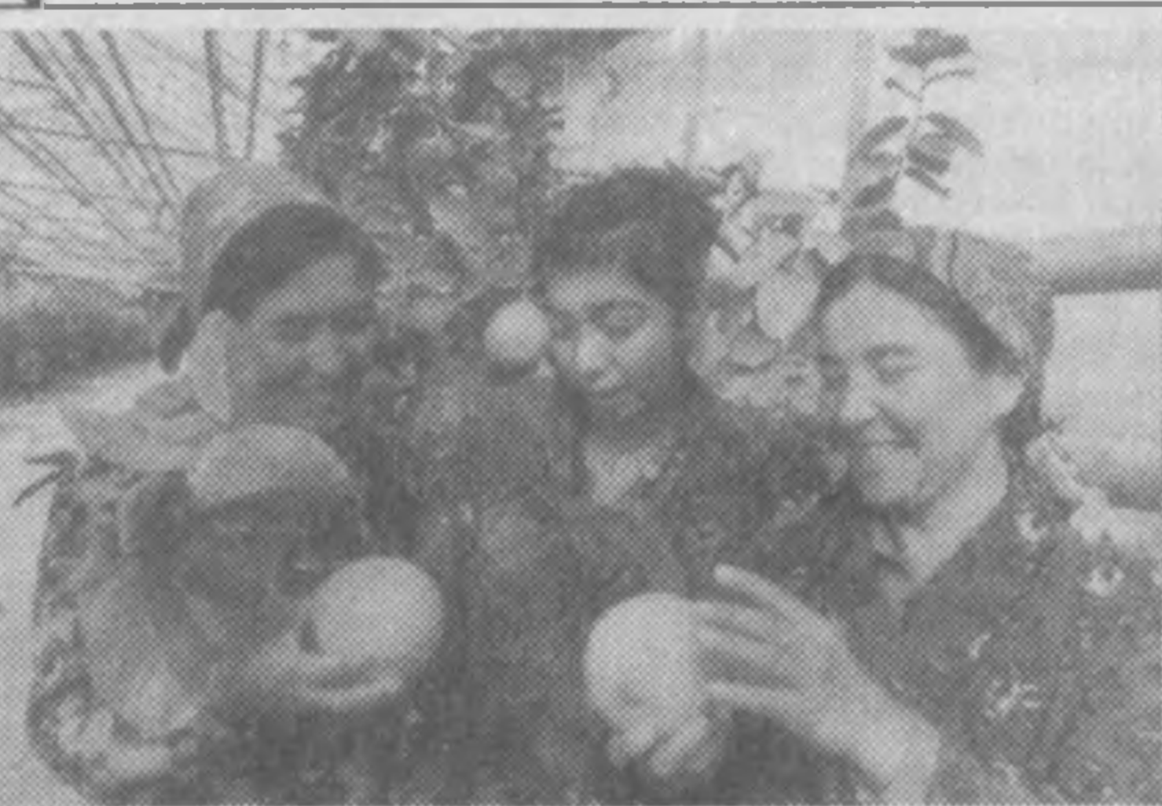
Урганч туманидаги Жалолиддин Мангуберди номи жамоа ҳўжалигининг лимонзори 1,5 гектарга етди. Деҳқонлар мавжуд майдондаги иссиқхонадан кейинги йили ҳосил олишни режалаштиришган. Айни пайтда ҳўжалик иссиқхонаси 6 гектардан зиёд. Иссиқхонанинг бир қисмида бодринг, помидор, гул

Улар суднинг тақрибли судьясимонлиги Отақузиёв, Иброҳимов, Тамара Полякова, Ёгина Семёнова, Мухсин Уй, Каримов Носир, Ҳайрхонова, Мунавварова, Полфренкова, Фатхулло Асоиди ва бошқалар билан бирга астойдил меҳнат қилишиб, суд фаолиятининг самаралигини оширишга эришилди.