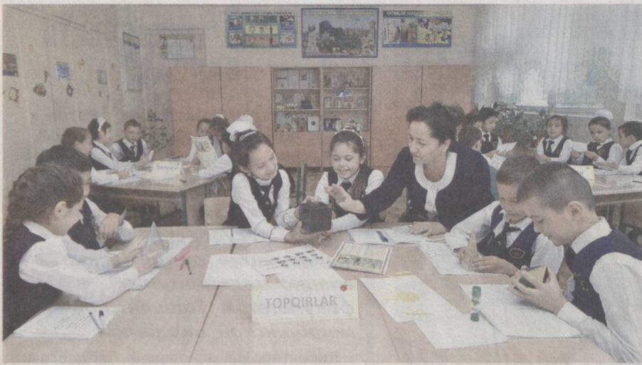
Во время школьных и внеклассных занятий дети развивают свои творческие способности.