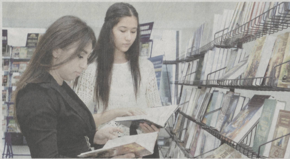
Книга — источник знаний о родном крае.