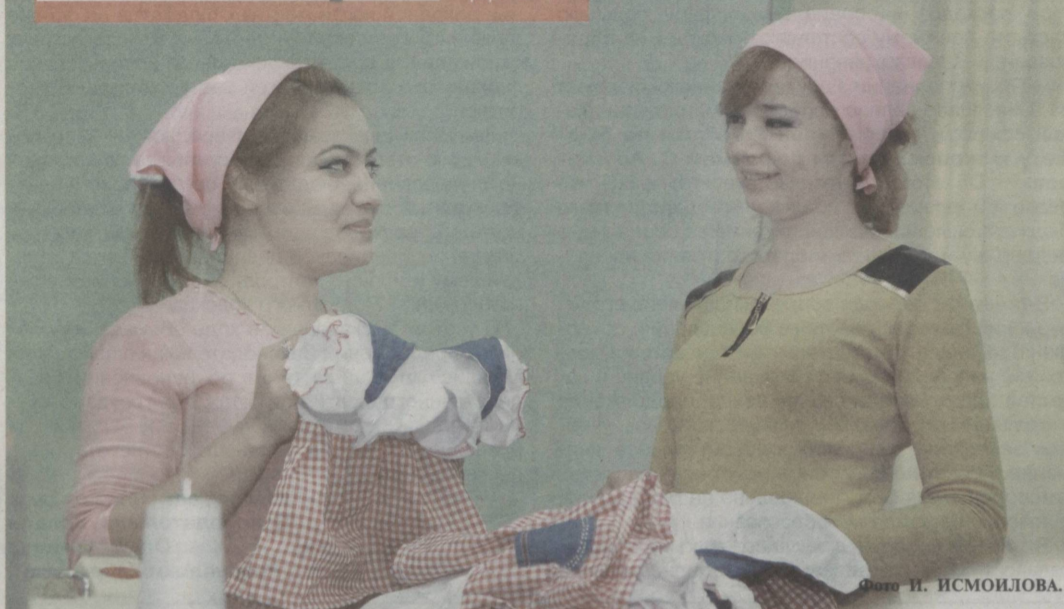
Повышается качество и конкурентоспособность товаров легкой промышленности.