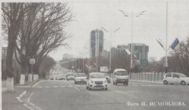
Широкие, современные проспекты — неотъемлемая составляющая облика столицы.

Решением этой задачи успешно занимаются отечественные ученые, в том числе специалисты государственного унитарного предприятия «Фан ва тараккиёт». При проведении научных исследований была установлена принципиальная возможность разработки эффективной технологии производства композиционных материалов для герметизации деформационных швов бетонных и трещин асфальтобетонных дорог, эксплуатирующихся в экстремальных условиях. Путем физико-химической модификации битумов и госсиполовой смолы различными ингредиентами, такими как гидролизный лигнин, резинового крошка, вторичный полиэтилен и поливинилхлорид, достигнуто увеличение их температуры размягчения от 40–500°C до 70–800°C. Как показали наши исследования, механоактивированные природные пески из-за развитой по-