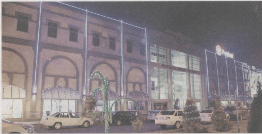
Столица украсилась новогодней иллюминацией.