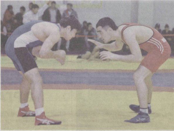
Спорт — путь к совершенству.