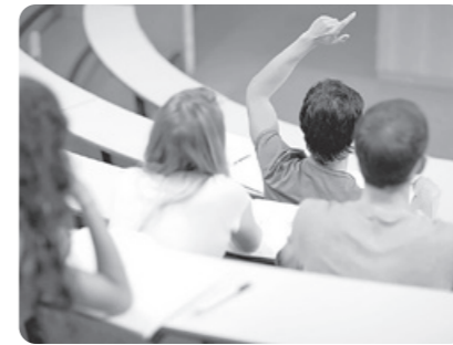
Олий таълим муассасалари талабаларининг ЎЗБЕКИСТОН ЭКОВОЛОНТЁР ТАЛАБАЛАРИ ҲАРАКАТИ ташкил этилади.