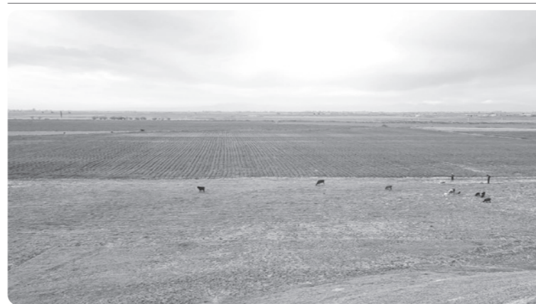
МЕНДА САВОЛ БОР...

Яъни ҳеч қандай шахс ёки муассаса ер масаласини "пул эвазига" ҳал қила олмайди. Бундай ваъдалар — фақат фирибгарлик . Агар сизга ер олиш, тоифа ўзгартириш каби масалаларда шубҳали таклифлар берилаётган бўлса, дарҳол ҳуқуқни муҳофаза қилувчи органларга мурожаат қилинг. Бу — нафақат сиз, балки бошқа фуқароларнинг ҳам ҳуқуқ ва манфаатларини ҳимоя қилишга хизмат қилади.