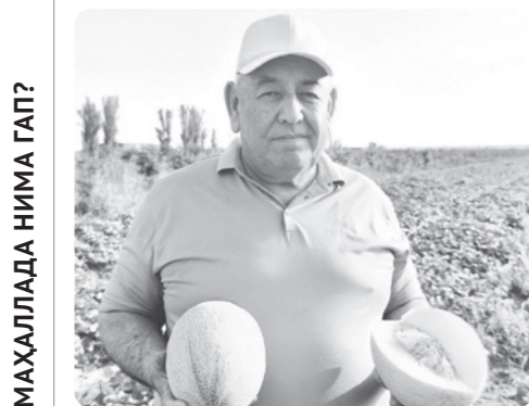
МАҲАЛЛАДА НИМА ГАП?

Утган йили боғ қатор ораларига қовун экиб, юқори ҳосил ва мўл даромад олган деҳқон бу йил ўз фаолиятини кенгайтириш мақсадида қарийб 8 гектарга қовуннинг "Дақара" навлисини экди. Жорий йил март ойи бошида ерга қадалган қовун кўчатлари айни кунларда пишиб етилди ва ҳосилни йиғиш ишлари бошланди.