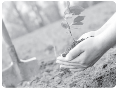
“ЯНГИ ДАРАХТ – ЯНГИ НАФАС” республика экомпеионати амалга оширилади.