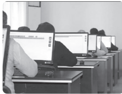
Аттестация синовларида юқори балл олган педагогларга кўшимча 70 фоиз УСТАМА БЕЛГИЛАНДИ.