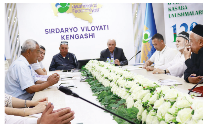
авлод учрашувлари қизгин тус олаётганини таъкидлади.

Сўхбат чоғида фахрийлар билан ишлашни янада яхшилаш, концертлар, саёҳатларга олиб бориш, хонадонларига ташриф буюриб, ҳол-аҳволларидан хабар олиш масалалари юзасидан тақлифлар билдирилди.