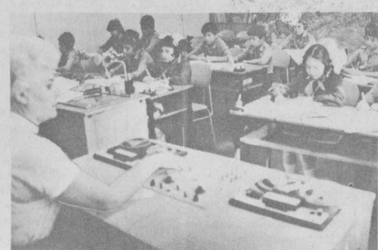
Совместно с учителями и специалистами предприятий, организованных по созданию кружков и факультетов юных программистов, вычислителей, отделения наук, что важно для повышения грамотности молодого поколения.