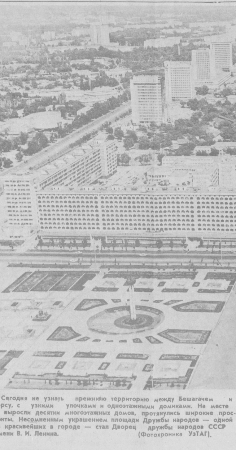
Сегодня не узкий улочками и односторонними домиками. На месте выросли десятки многоэтажных домов, протянулись широкие проспекты.

К чему ведет нерасторопность Встретились два руководителя ЖЭУ у мусорной свалки. Один сказал: «Ого, как выросла!»