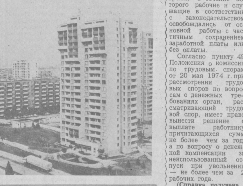
НА СНИМКЕ: новый жилой район «Младост».

София — крупный промышленный, культурный и научный центр страны. За последние годы на месте бывших окраин выросли благоустроенные районы, такие, как «Зона-Б-5», «Младост», «Дружба». Сооружаются культурные комплексы, школы, детские сады, поликлиники, магазины. Динамичное развитие города полностью отвечает девизу, начертанному на его гербе: «Растет, но не стареет».