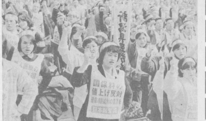
Массовая манифестация японских трудящихся со состоялась в токийском районе Касугингаси. Она прошла под лозунгом «Нам нужны не истребители и корабли, а школы и больницы». Манифестанты (на снимке) выступили с решительной критикой внутренней политики кабинета консерваторов, ведущей к сокращению ассигнований на образование, ликвидации льгот и пособий наиболее нуждающимся слоям населения. Выступившие на митинге ораторы осудили и планы правительства в ближайшем будущем закрыть десятки государственных больниц и домов для престарелых и по соображениям «экономики». Данная манифестация стала значительной вехой в борьбе японского народа за свои права, против развернутого капитализма наступления на социальные программы.